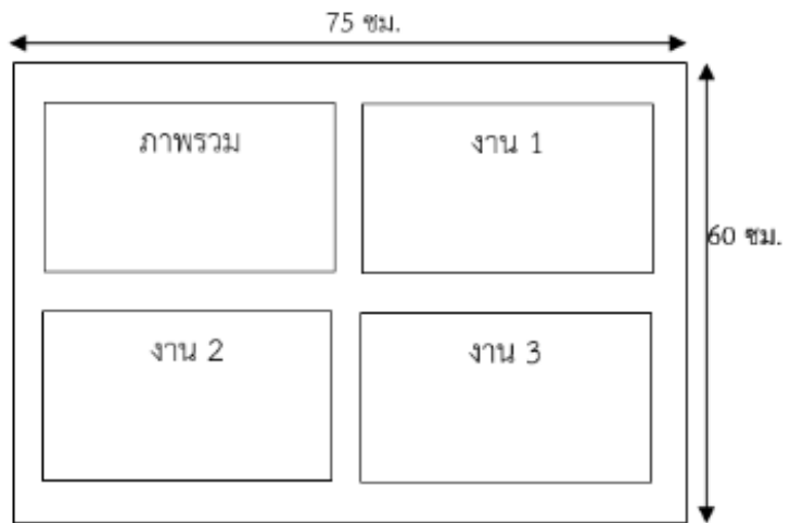
ชาร์ตผลงานจากโปรแกรมคอมพิวเตอร์สำเร็จรูป 3 มิติ