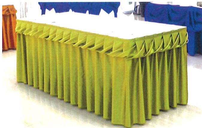
ลายเกลียว