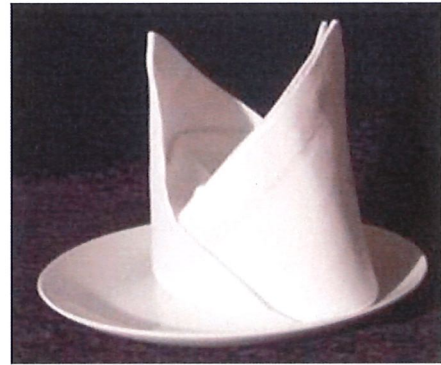
ลายหมวก (Bishop Hat)