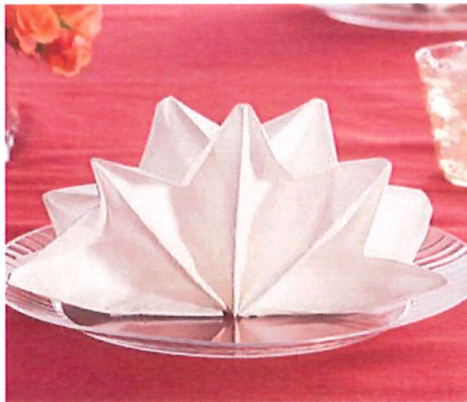
ลายพัด (Double fan)