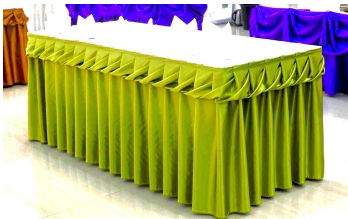
ลายเกลียว