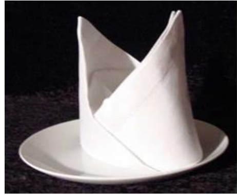
ลายหมวก (Bishop Hat)