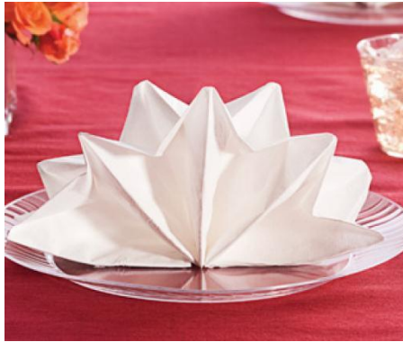
ลายพัด (Double fan)

เกณฑ์ กติกา การแข่งขันทักษะวิชาชีพ และทักษะพื้นฐาน ประเภทวิชาอุตสาหกรรมท่องเที่ยว สาขาวิชาการโรงแรม ทักษะการบริการอาหารและเครื่องดื่ม ระดับประกาศนียบัตรวิชาชีพ (ปวช.) หรือระดับประกาศนียบัตรวิชาชีพชั้นสูง (ปวส.) ระดับสถานศึกษา ระดับจังหวัด ระดับภาค และระดับชาติ ปีการศึกษา 2565-2567